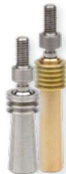
Taponamiento de Tubos con Fugas Pop-A-Plug®